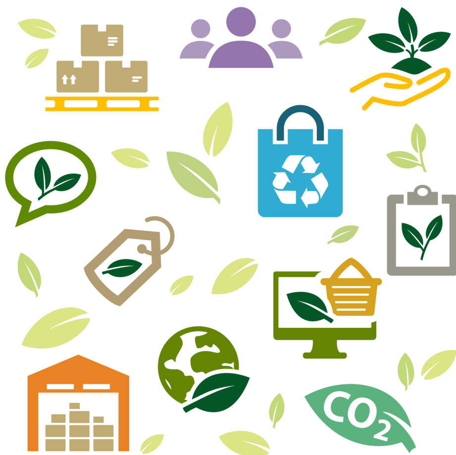
Schéma de Promotion des Achats Socialement et Ecologiquement Responsables